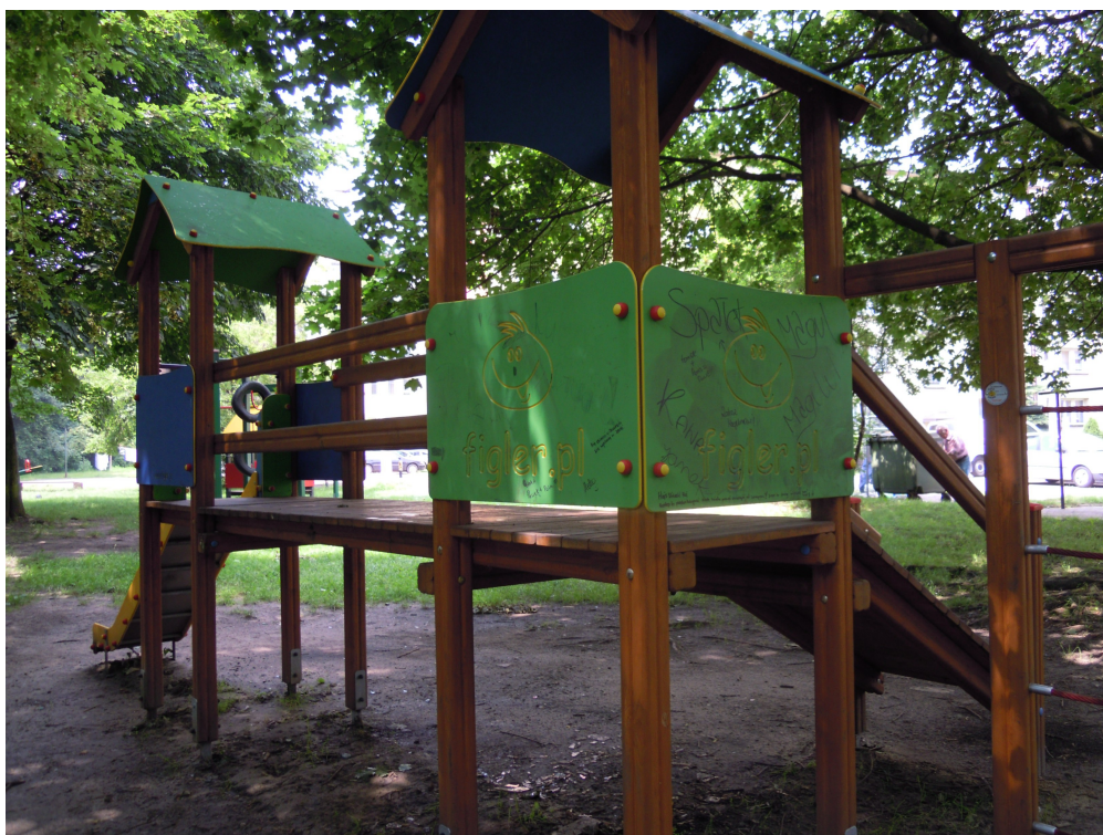
Fot. 2. Zestaw zabawowy do przeniesienia zgodnie z rysunkiem dokumentacji projektu zagospodarowania terenu