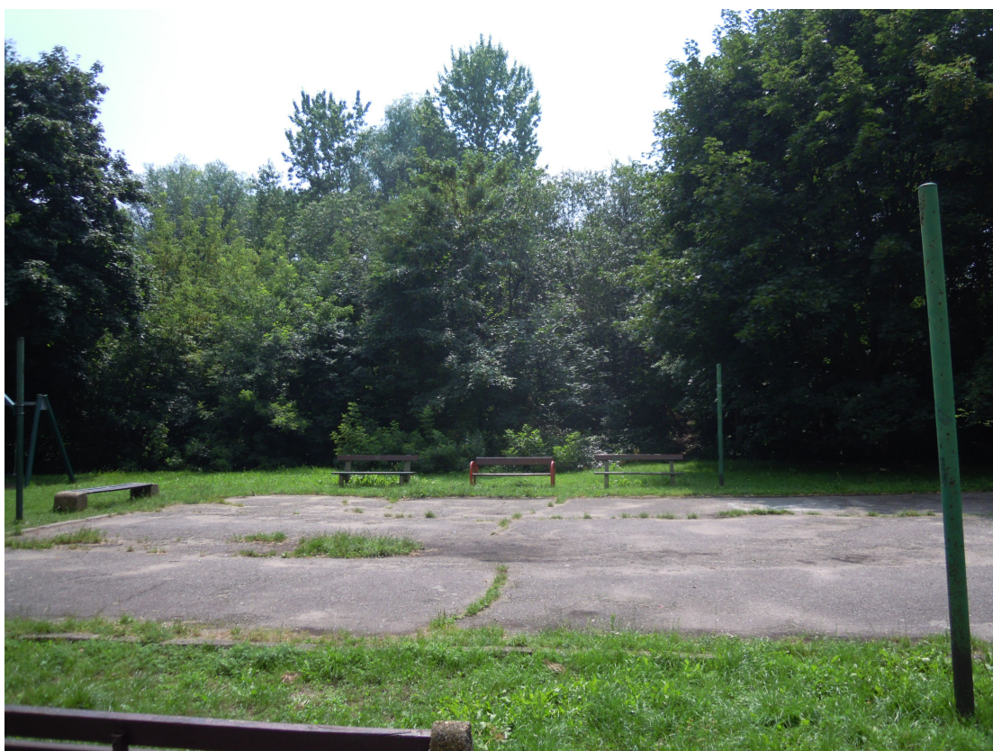
Fot. 6. Boisko