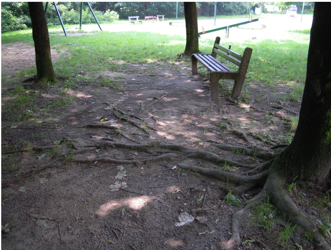
Fot. 5. Istniejący drzewostan