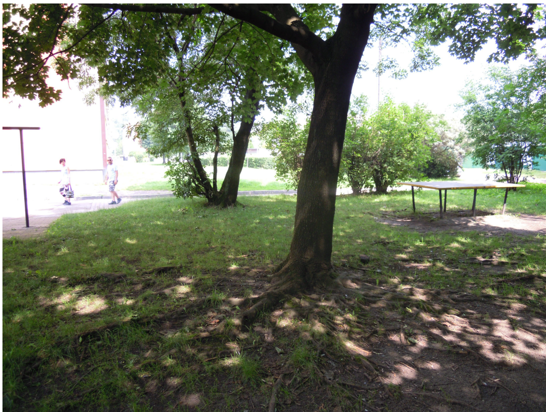
Fot. 3. Widok w kierunku osiedla „Podgórze”