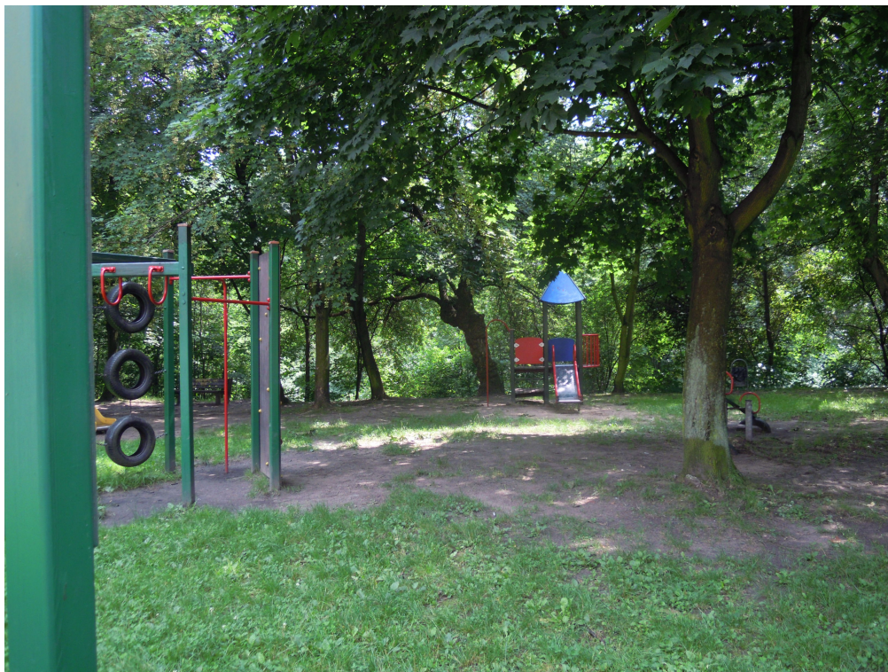
Fot. 1. Widok istniejącego placu zabaw w kierunku południowym